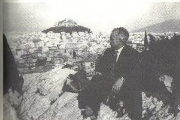
Γύρω στο 1985 πάνω στο λόφο του Φιλοπάππου.