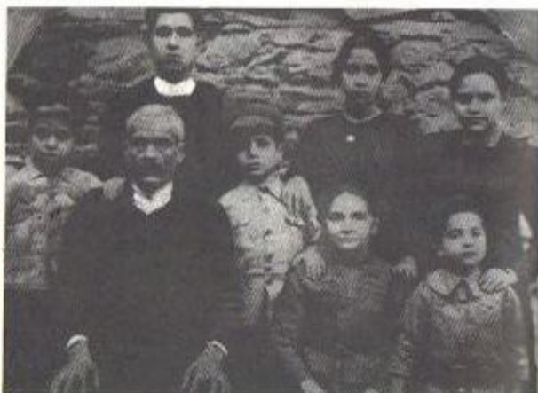
Η οικογένειά μου όλη από το προσφυγικό βιβλιάριο του 1919 που πολιωνοστήσαμε στη Μικρά Ασία. Είμαι στο μέσο της φωτογραφίας. Στην κοιλιά της μάνας ένα παιδί που πέθανε.

Η Ευαγγελική Σχολή της Σμύρνης ήταν όπως η Μεγάλη του Γένους Σχολή στην Κωνσταντινούπολη. Σπούδαζες εκεί διάφορες επιστήμες. Αλλά έγινε ο διωγμός κι εγώ πού να