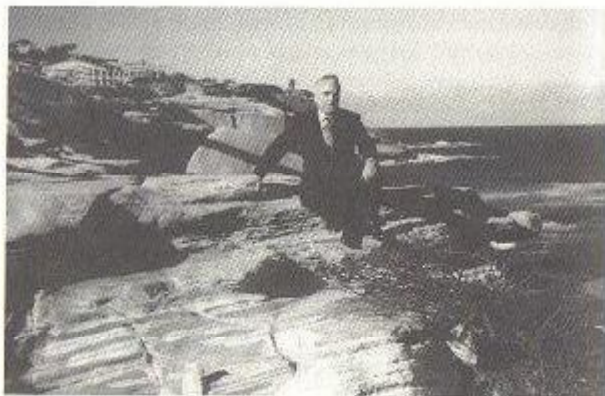
Αυστραλία, 1962, στο ακρογάλι Μποντά Μπιτς.