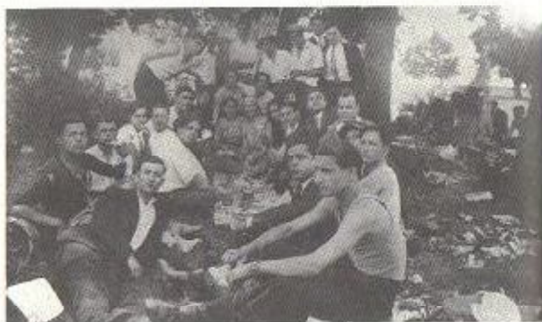
Από εκδρομή το 1928 στο Τέκελι, στη Σίνδο. Πολλοί σύντροφοι, Καπινεργάτες, Εβραίοι.