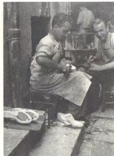
Στο εργοστάσιο του Μεταξά στη Χαριλάου Τρικούπη, μ' έναν άλλο τσαγκάρη. Είναι καλοκαίρι και δουλεύουμε έξω. Γύρω στο 1950.

Αυτή είναι και η δική μου άποψη. Ύστερα από τις προδοσίες του σταλινισμού και τη χρεωκοπία της θεωρίας του εκφυλισμένου εργατικού κράτους, ύστερα από τη συμφωνία Χίτλερ-Στάλιν και το διαμελισμό της Πολωνίας, εμάς πλέον άρχισαν να μας χωρίζουν ζητήματα αρχής και από τον ίδιο τον Τρότσκι και από τους τροτσκοιτές γενικά, οι οποίοι παρέμειναν κολλημένοι στη θεωρία του εκφυλισμένου εργατικού κράτους, που προσπαθούσαν να μεταρρυθμίσουν. Θεωρούσαμε ότι αυτοί δεν ήταν προδότες συνειδητά, αλλά ότι ήταν εσφαλμένες οι εκτιμήσεις τους. Και ο Τρότσκι ήταν συναισθηματικά δεμένος μ' αυτούς, επειδή πήρε μέρος στην οκταβριανή επανάσταση και δεν ήθελε να ξεχωρίσει τον εαυτό του από το δημιούργημά του. Κι έτσι, παρ' όλες αυτές τις προδοσίες του σταλινισμού, εξακολουθούσε να έχει την αυταπάτη ότι εί-