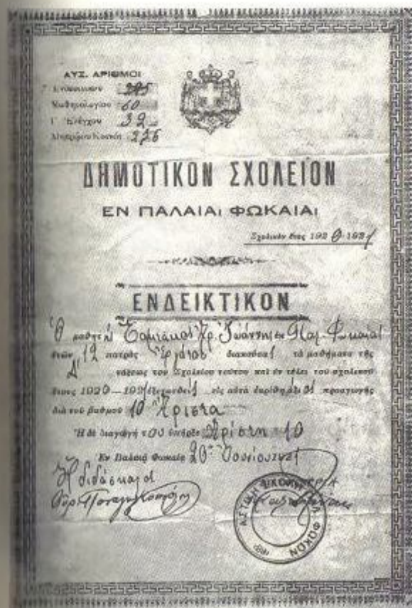
Η τελευταία σχολική χρονιά: το ενδεικτικό της Δ' Δημοτικού το 1921.