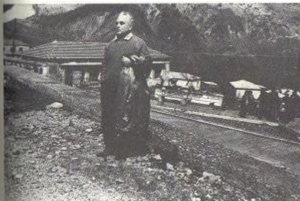
Στα Μετέωρα, στη δεκαετία του '70.

Ο Στίνας είχε κάνει σωστή εκτίμηση. Και πράγματι σε μια βδομάδα κηρύχθηκε η δικτατορία του Παπαδόπουλου, οπότε βλέπω το Λουκά και τον λέω ειρωνικά: "Είδες; Έγινε η δικτατορία του προλεταριάτου που έλεγες!"