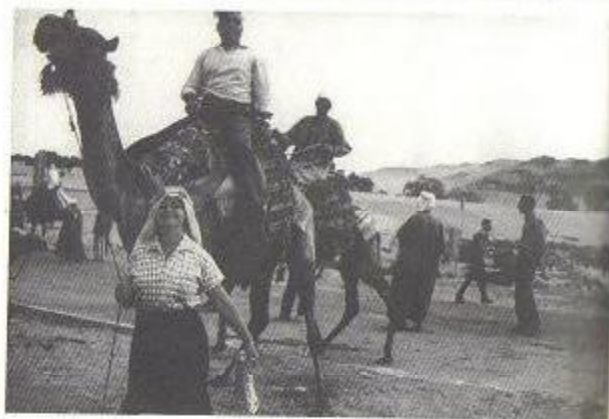
Με το φέσι πάνω στην καμήλα.

Εκεί στην Αυστραλία έμαθα και για τον Μπελογιάννη. Αυτός είχε διαφωνήσει τότε με την επίσημη ηγεσία, με το Ζαχαριάδη, και τον στέλνανε σε επικίνδυνες αποστολές στην