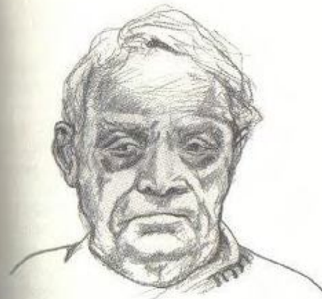
ΤΑ ΠΡΩΤΑ ΧΡΟΝΙΑ (1908-1930)