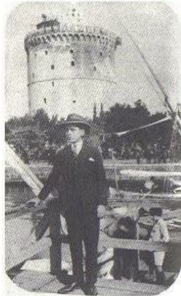
20 χρονών τσαγκάρης, μπροστά στο Λευκό Πύργο.

Το σπίτι που αγοράσαμε ήταν στο Κουλέ Καφέ, στο τέμα Ηροδότου, εκεί που είναι ο Άγιος Νικόλαος ο Ορφανός, κοντά στην πλατεία Τερψιθέας. Εκεί καθίσαμε και συν το χρόνω αυξηθήκαμε και πληθύναμε, σκορπίσαμε δεξιά-αριστερά, παντρεύτηκαν τ' αδέρφια μου κι οι αδερφές μου, η οικογένεια μεγάλωσε. Εγώ έγινα τσαγκάρης, έμαθα μια τέχνη. Τότε λέγανε μάθε τέχνη κι άστηνε κι αν πεινάσεις πιάστηνε . Ο τεχνίτης όμως είναι πάντα πεινασμένος. Οπότε εμείς το είχαμε μετατρέψει και λέγαμε μάθε τέχνη για να ζήσεις και εμπόριο να πλουτίσεις!