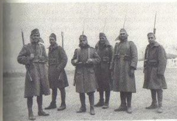
Περυπολία στο 50ο Σύνταγμα (τρίτος από αριστερά).