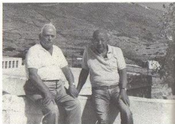
Με τον Κορνήλιο Καστοριάδη στο σπίτι του στην Τήνο.

είχε αλληλεγγύη. Όταν κάναμε απεργίες, βοηθούσαν και οι εργάτες από τα άλλα επαγγέλματα, κατέβαιναν στην απεργία σε συμπαράσταση του άλλου κλάδου, κάνανε εράνους και βοηθούσαν. Όταν δημιουργήθηκαν τα λεγόμενα εθνικοαπελευθερωτικά κινήματα, χάθηκε αυτή η ζεστασιά. Άρχισαν όλοι να λένε ότι πρέπει να φύγει ο κατακτητής για να ζήσουν καλύτερα, οπότε διώξαν τους γερμανούς κατακτητές και φέρνανε τους Έλληνες κατακτητές, αντί να κάνουν κοινωνική επανάσταση και κοινωνική αλλαγή. Έτσι χειροτέρευσαν τα πράγματα: άρχισαν οι επιτροπές ασφαλείας, τα πιστοποιητικά κοινωνικών φρονημάτων, ήλθε η Δεξιά.